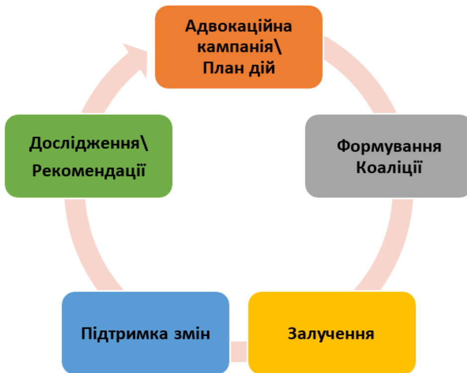
Схема 1. Форми адвокаційної діяльності – адвокація для змін

єте адвокаційну кампанію, то має сенс розробити план дій, спрямований на поетапне розв'язання проблеми. На цьому адвокація не завершується, оскільки ви відповідальні за імплементацію / впровадження ваших рекомендацій. Якщо ви хочете побачити результати вашої праці, постійно спілкуйтеся з тими, від кого залежить позитивне вирішення, запитуйте, інформуйте, слідкуйте, вимагайте, покажіть свою зацікавленість у результативному розв'язанні проблеми. Схематично форми адвокаційної діяльності показані на Схемі 1, а більш повна характеристика, кожної форми представлені у Посібнику.