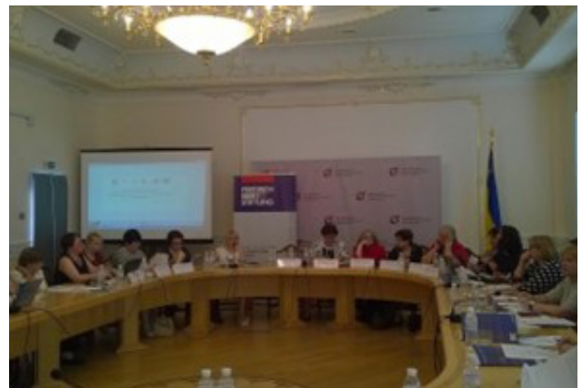
Фото. Київ, Україна, Секретаріат Уповноваженого Верховної Ради з прав людини, 20.09.2019. Жіночі організації презентують Паралельний звіт спільно з Уповноваженим Верховної Ради України з прав людини.

В кейсі представлена виконана 2019 року моніторингова та адвокаційна робота українських жіночих організацій щодо стану дотримання прав жінок, з опорою на залучення міжнародних моніторингових механізмів, а саме – Пекінської платформи дій. Описано процес паралельного звітування жіночими організаціями за 25-річний період імплементації в Україні Пекінської платформи дій; а також, написання ними першого за чверть сторіччя паралельного звіту «Пекін + 25: Україна», самостійно виконаного лише ресурсами партнерських жіночих організацій. Висвітлені подальші адвокаційні кроки жіночої громадськості у її діалозі з урядом України та з глобальною феміністською спільнотою, зроблені на основі цього звіту. Показані окремі результати діяльності.