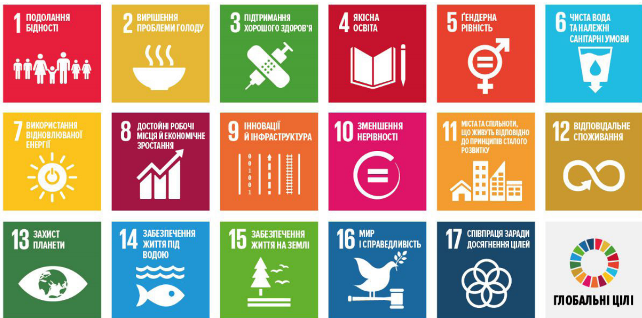
Схема 2. ЦСР для України

ти), до яких входять 86 національних завдань та 172 індикатори для моніторингу процесу їх досягнення. Згідно з Індексом ЦСР, рейтинг України складає 75,51 балів, що відповідає 36 місцю серед 165 країн світу. У розділі подаються базові факти та події щодо національного урядового рівня імплементації Порядку денного до 2030 року в Україні.