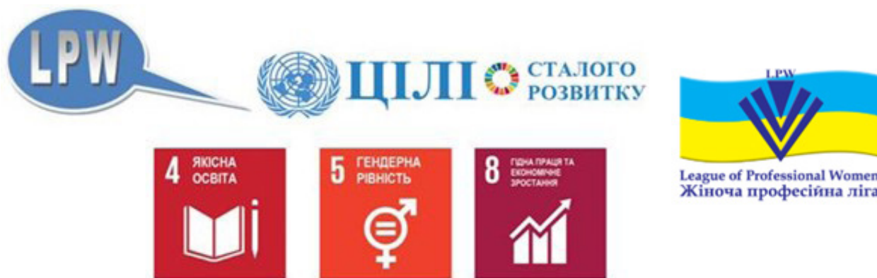
Схема 3. Пріоритетні для Жіночої Професійної Ліги (LPW) Цілі сталого розвитку.

які були визначені як пріоритетні для Ліги у процесі імплементації, дослідження, моніторингу та адвокації. У 2020 році громадські експерти були задіяні у консультаціях та підготовці рекомендацій першого урядового “Добровільного національного огляду України”. Досвід локалізації ЦСР в Україні був представлений авторкою в декількох англійських публікаціях для німецького онлайн журналу Arts Management Quarterly, 2017 році та для міжнародного порталу “Переосмислення демократії” (англ. Reimagining Democracy), який адмініструє CIVICUS, влітку 2018 року.